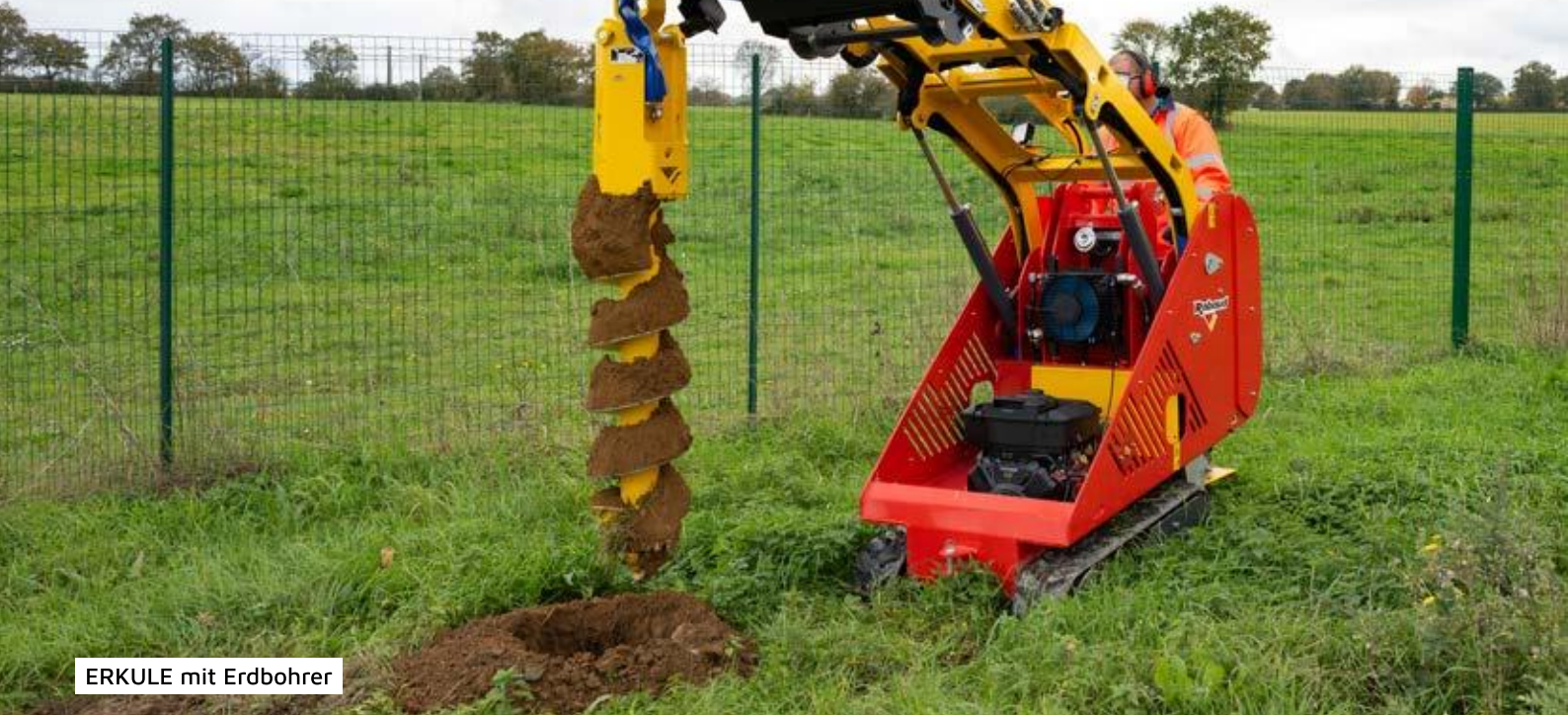
ERKULE mit Erdbohrer