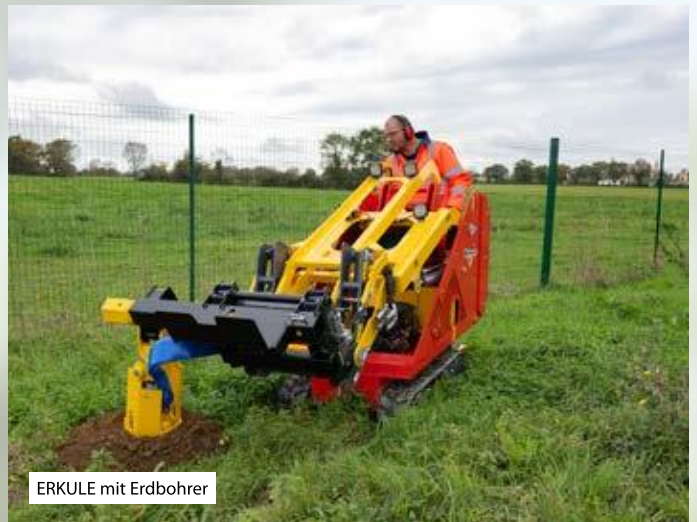
ERKULE mit Erdbohrer