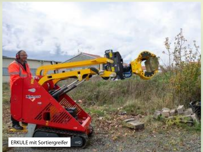
ERKULE mit Sortiergreifer

Design: Abteilung Kommunikation/Marketing RABAUD 02/2026 - Die technischen Daten und Fotos sind unverbindlich und können ohne Vorankündigung geändert werden.