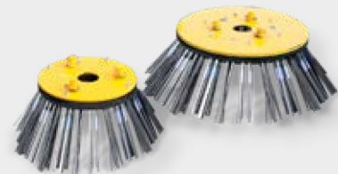
2 Bürstendurchmesser zur Auswahl