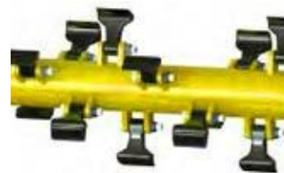
Rotor mit mobilen Schlegelhammern