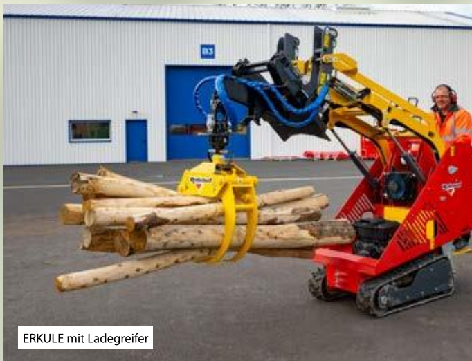
ERKULE mit Ladegreifer