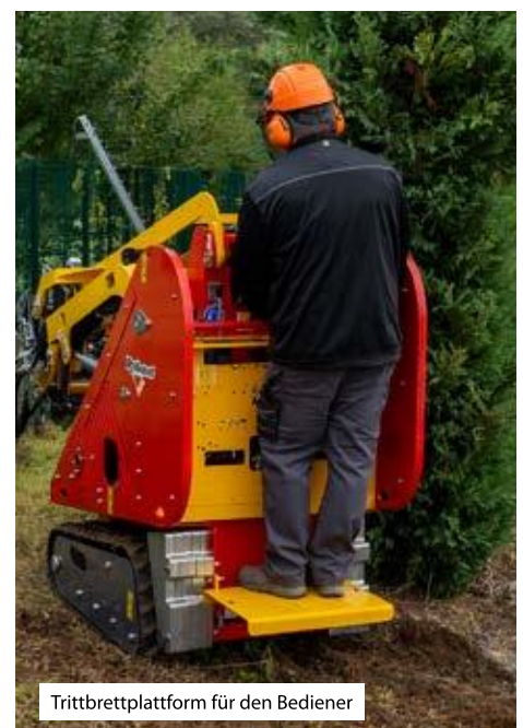
Trittbrettplattform für den Bediener