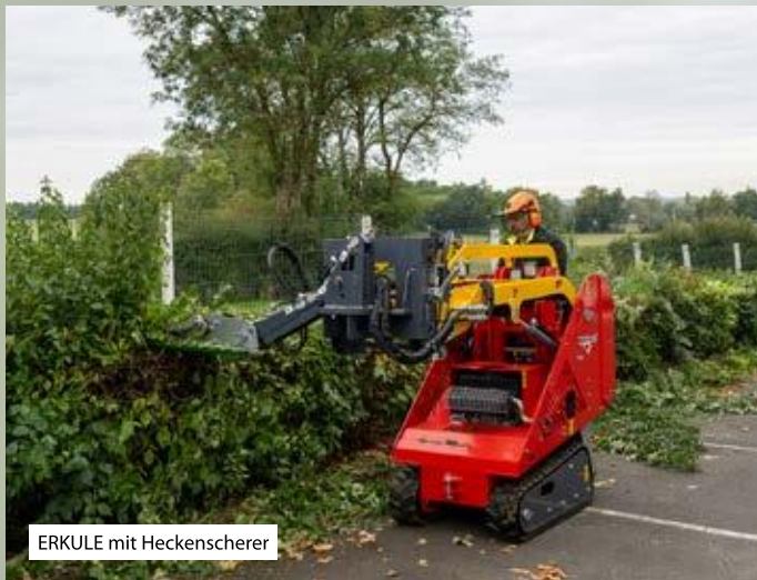
ERKULE mit Heckenscherer