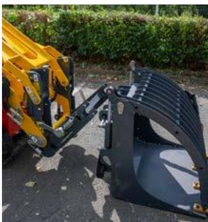
Hubarm mit Schnellwechsler, kompatibel mit einer Vielzahl von RABAUD-Werkzeugen