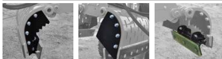
Anschraubare geriffelte Seitenwände