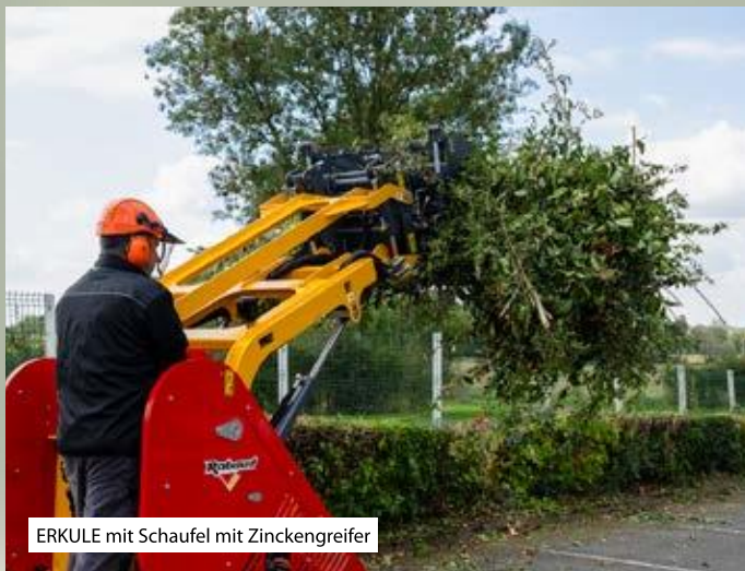
ERKULE mit Schaufel mit Zinckengreifer