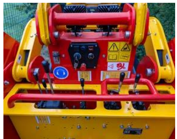
Steuerung per Multifunktionshebel (Minibagger)