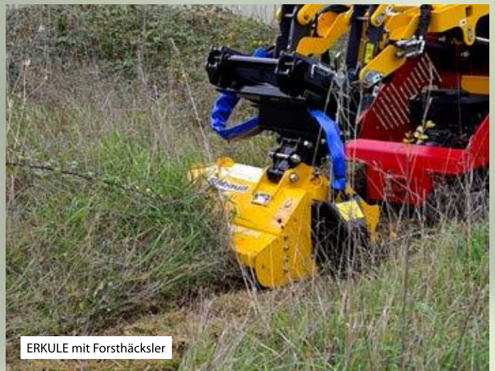
ERKULE mit Forsthäcksler