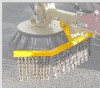
Spritzschutz mit Kettenvorhang