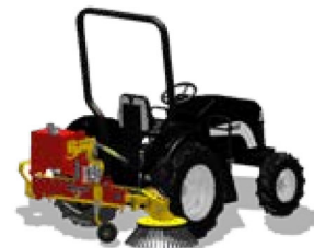
2 HERBIONET - CH Heckanbau mit Aggregat