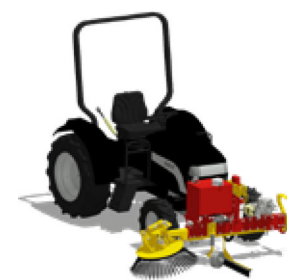
3 HERBIONET - CH Aggregat auf der Bürste