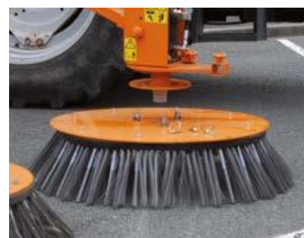
Schnelle Montage / Demontage der Bürsten ohne Werkzeug