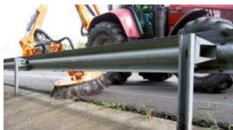
Unkrautvernichtung unter Rutschen