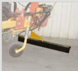
Spritzschutz mit Gummileiste