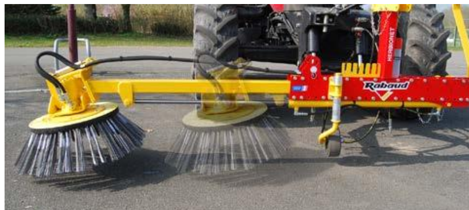
Hydraulischer Versatz von 0,90 m für einfachen Zugang zu den entferntesten Stellen