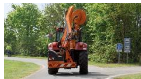
Kompakte Maschine beim Transport