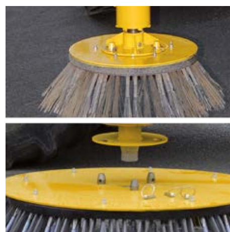
System zur Montage/Demontage Schneller Bürstenwechsel ohne Werkzeug