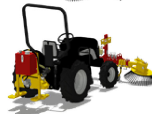
4 HERBIONET - CH Heckanbau des Aggregats Frontanbau der Bürste