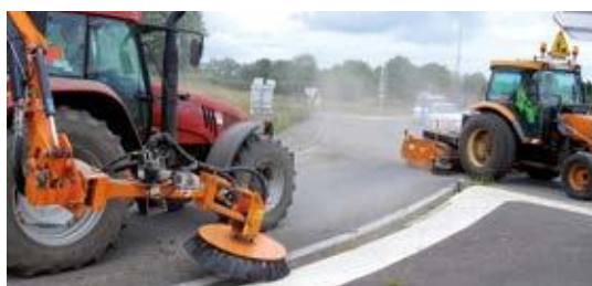
Unkrautvernichtung Insel + Kehrmaschine mit Aufnahmegarät TURBONET