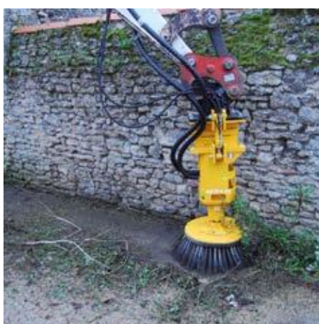
Hydraulikmotor mit hohem Drehmoment, für intensive Arbeit