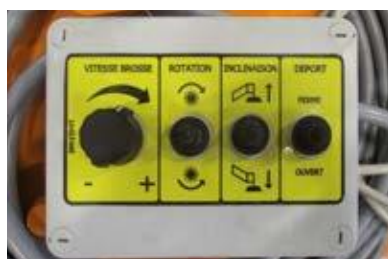
Bedienelemente in der Kabine