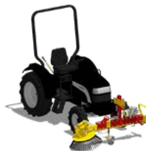
1 HERBIONET - PH Frontanbau ohne Aggregat