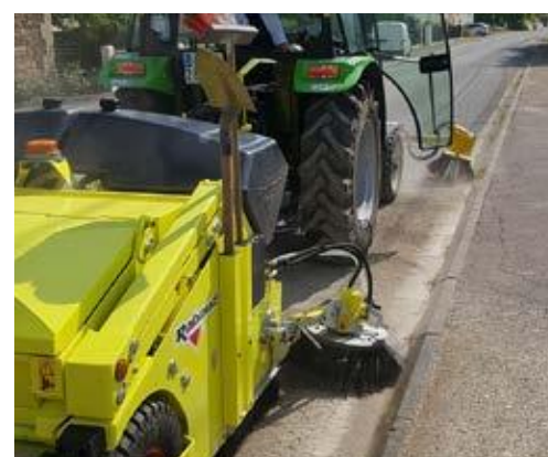
Bürste vorne + URBANET-Aufnahmekehrmaschine hinten