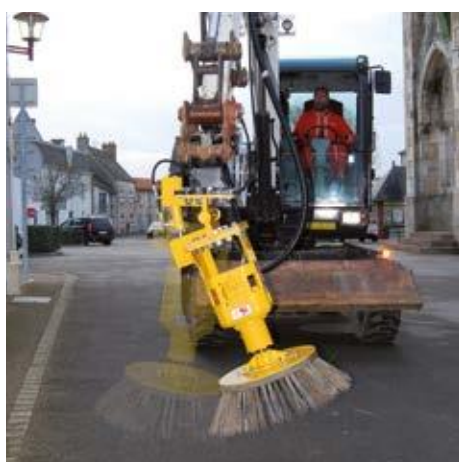
Optional mechanische Neigung oder hydraulische Bürste