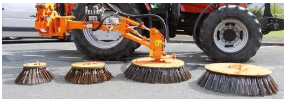
4 Bürsten zur Auswahl: Ø 500, 750, 1000 oder 1200 mm