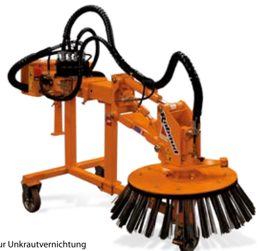
Bürste zur Unkrautvernichtung auf Absetzwagen